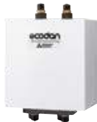
Ecodan 2-piiri kitti PAC-TZ01

* Nimellisteholla, ulkolämpötila +7°C, menovesi +35°C